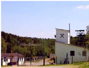
5. Grube Glasebach Straßberg