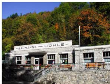
15. Rübäländer Höhlen