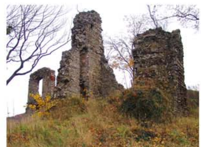
20. Burgruine Stecklenburg