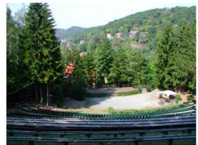
13. Freilichtbühne Altenbrak