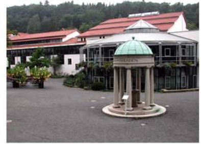
4. Calciumsole-Quelle Bad Suderode