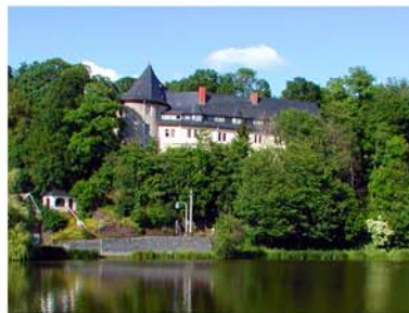
11. Schloss Stiege