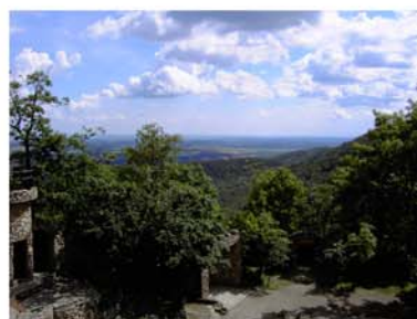
19. Hexentanzplatz Thale