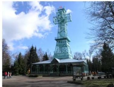
6. Josephskreuz - Großer Auerberg