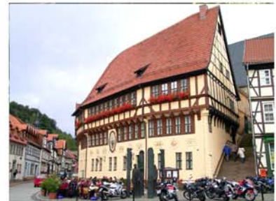
7. Stolberg Altstadt