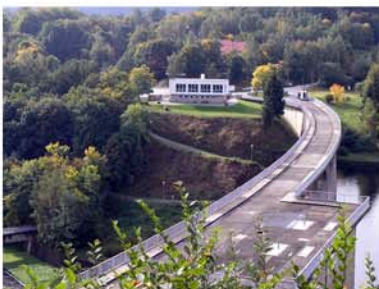
14. Staumauer Wendefurth