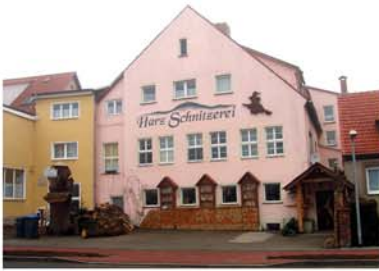
1. Harz Schnitzerei Rieder