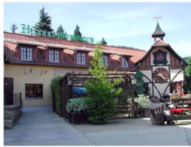
3. Harzer Kuckucksuhrenfabrik