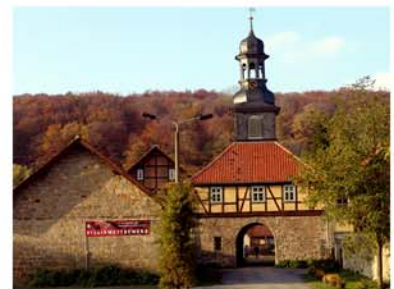
16. Kloster Michaelstein Blankenburg