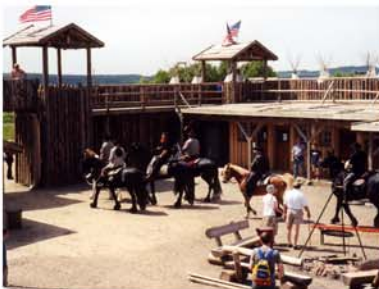
10. Westernstadt Pullman City